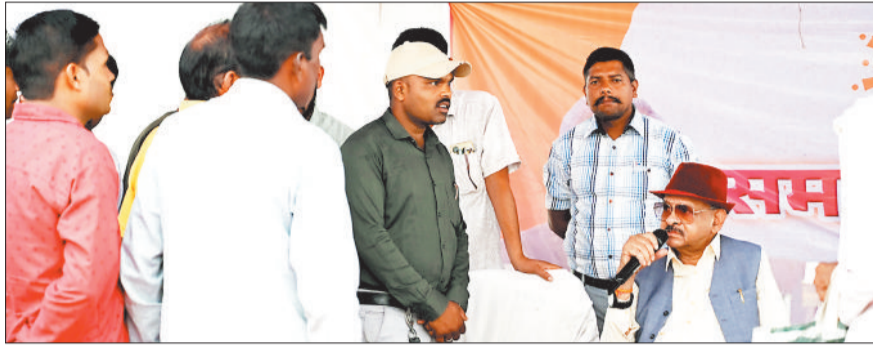
ग्रामीणों से चर्चा करते विधायक, 2 में प्रमाण देते जिय अध्यक्ष।