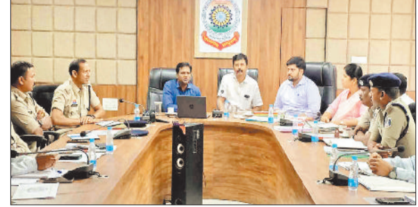
बैठक लेते कलेक्टर एवं एसएसपी।