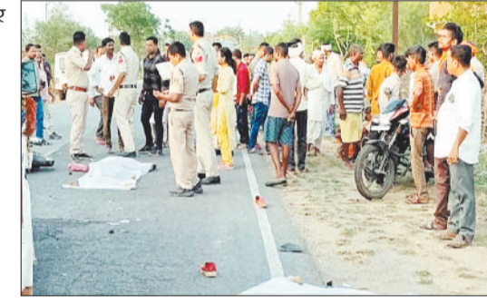
दुर्घटना के बाद बस एवं ट्रक के चालक मौके से फरार हो गए।