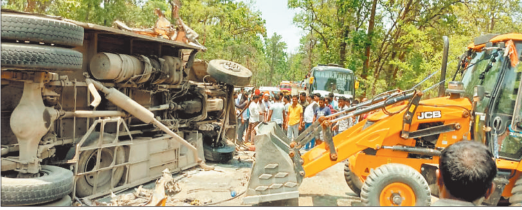
दुर्घटनाग्रस्त बस व लोगों की भीड़।