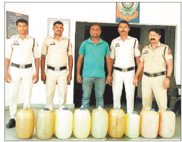
पुलिस गिरफ्त में आरोपी व जब्त डीजल।